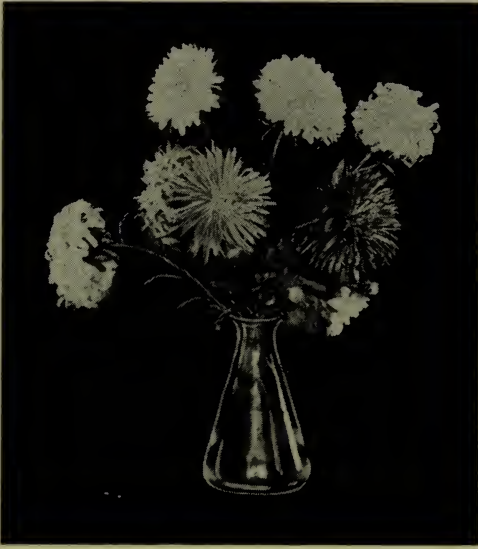
Aster de Chine (Voir Callistephus ).